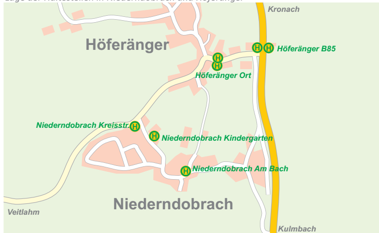
Lage der Haltestellen in Niederndornlach und Höferänger

Bedarfsgesteuerte Verkehre: Sie müssen Ihren Fahrtwunsch vorab anmelden. VBS Variobus: telefonische Voranmeldung bis siehe Zeit (rot) in Fahrplanmeldetele - Tel. 0 92 21 40 777 90 (6.30 bis 21 Uhr) oder unter www.fahrtwunschzentrale.de . Fahrzeiten können sich geringfügig verändern.