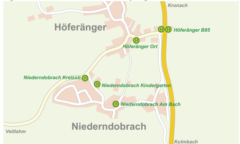
Lage der Haltestellen in Niederndobrach und Höferänger

Bedarfsgesteuerte Verkehre: Sie müssen Ihren Fahrtwunsch vorab anmelden. VBS Variobus: telefonische Voranmeldung bis siehe Zeit (rot) in Fahrplanmelleiste - Tel. 0 92 21 40 777 90 (6.30 bis 21 Uhr) oder unter www.fahrtwunschzentrale.de . Fahrzeiten können sich geringfügig verändern.