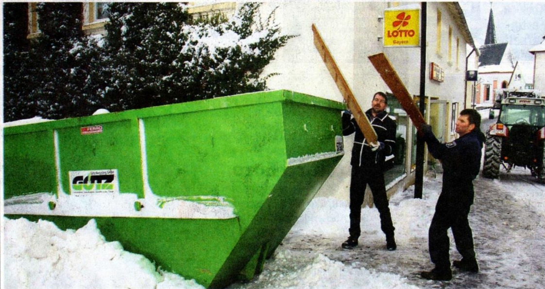
Ein Container steht bereit, damit der grobe Abfall aus dem ehemaligen Laden Schramm beseitigt werden kann.