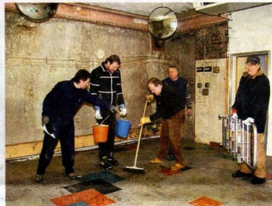
Viele fleißige Hände werden gebraucht.

Denn der Bürgermeister ist sich darüber im Klaren, dass viele helfende Hände nötig sein werden, um all die Arbeit, die in den nächsten Wochen anfallen wird, zu bewältigen. „Wir haben eine Liste mit rund zwanzig Helfern; wir wählen dann immer