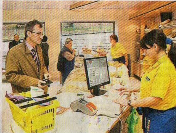
Die Kunden schätzen die große Auswahl und das freundliche Personal.

angenommen. Ein besonderes Augenmerk wird darauf gelegt, dass viele Produkte von heimischen Hofläden und Erzeugern stammen. „Unsere Kunden haben ein Bewusstsein für regionale Produkte und können damit Vertrauen in die gekauften Lebensmittel setzen“, so der Geschäftsführer.