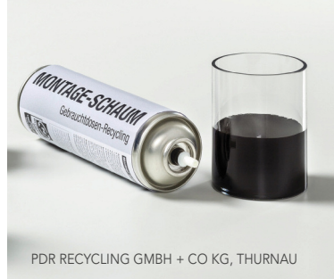
PDR RECYCLING GMBH + CO KG, THURNAU

INNOVATIONS HELDEN AUS DEM LANDKREIS KULMBACH