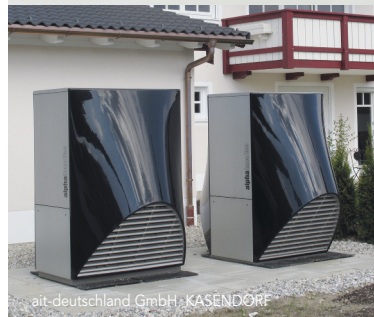
ait-deutschland GmbH, KASENDORF