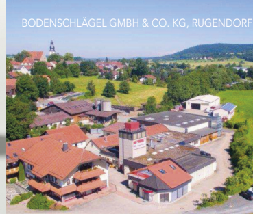
BODENSCHLÄGEL GMBH & CO. KG, RUGENDORF