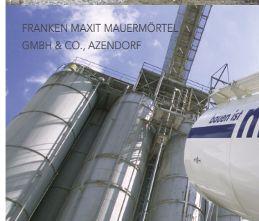
FRANKEN MAXIT MAUERMÖRTEL GMBH & CO., AZENDORF