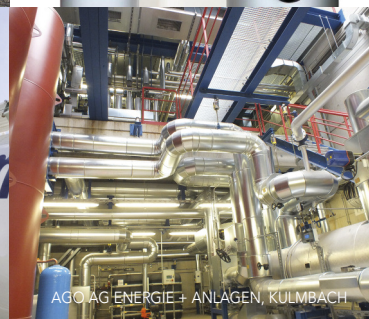
AGO AG ENERGIE + ANLAGEN, KULMBACH