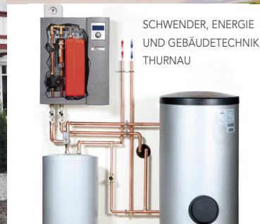
SCHWENDER, ENERGIE UND GEBÄUDETECHNIK, THURNAU